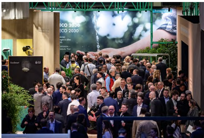
Colaboración, innovación, efecto: demos forma juntos al futuro de la sostenibilidad del agua.

El congreso Value of Water ofrece una plataforma global en la que presentar y debatir estrategias probadas, innovaciones y prácticas recomendadas en relación con la gestión del agua, el saneamiento y la higiene en edificios e infraestructuras. El objetivo es proponer soluciones sostenibles y justas para el agua mediante formatos interactivos y el diálogo con expertos internacionales. La visión de este punto de encuentro para expertos es fijar los temas del agua y la sostenibilidad en la agenda de la industria sanitaria, del agua y de la construcción, y concienciar a las empresas de las oportunidades que tienen de marcar una diferencia real mediante la cooperación y la innovación.